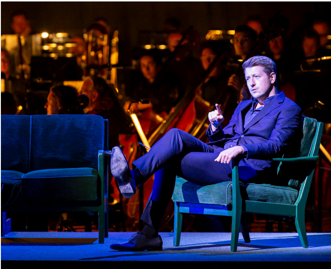
Dirigent Duncan Ward spreekt het publiek toe in de proloog tot 'Blauwbaards Burcht'.

Ward houdt de boel in de eerste scènes heel klein. De akoestiek van het Theater aan de Parade helpt dan niet echt mee. De klanken stromen te afgedekt en te omfloerst de zaal in. Maar het is wel in lijn met de nog zoekende geliefden dat Ward en zijn musici niet meteen al vol gas geven. Het valt in deze eerste helft ook op hoe lyrisch deze muziek eigenlijk kan zijn. En Ward bouwt het daarna magnifiek op. Bij het openen van de vijfde deur dendert het C-groot de zaal in, geholpen door extra trombones en trompetten die hoog achter in de zaal opgesteld staan.