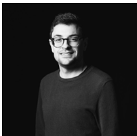
Matthew Eberhardt Regie