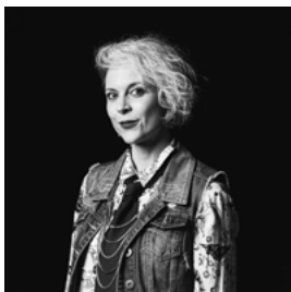
Zahra Mansouri Decor- & kostuumontwerp