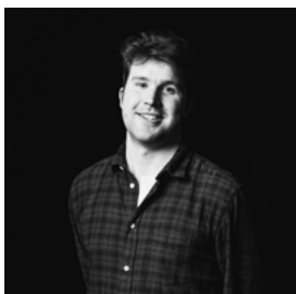
Danny Vavrečka Lichtontwerp